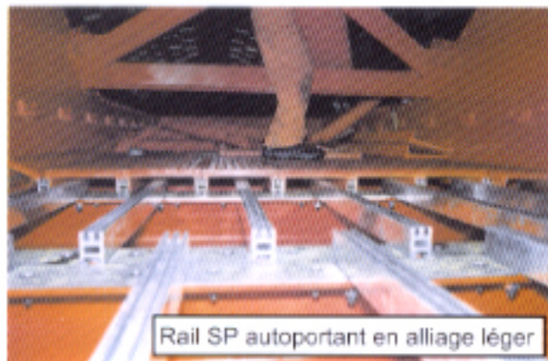
Rail SP autoportant en alliage léger