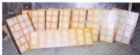
grilles pour essoreurs