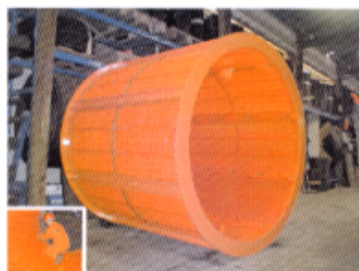
trommel cribleur CORETANE® SB