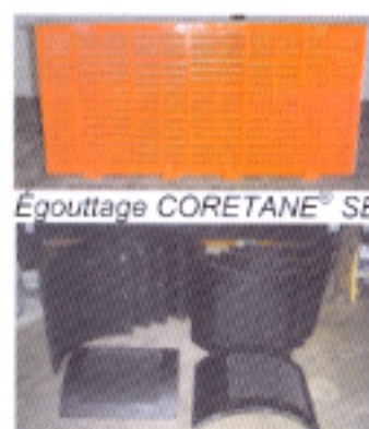
Égouttage CORETANE® SB