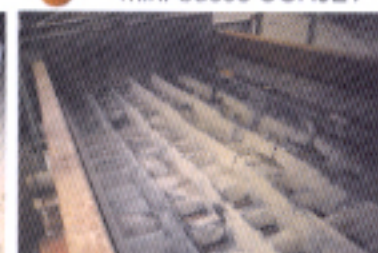
panneaux criblés en ARMACOR®