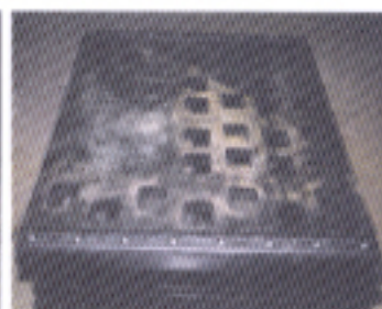
toiles ARMACOR® SB