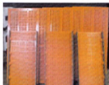
toiles CORETANE® SB