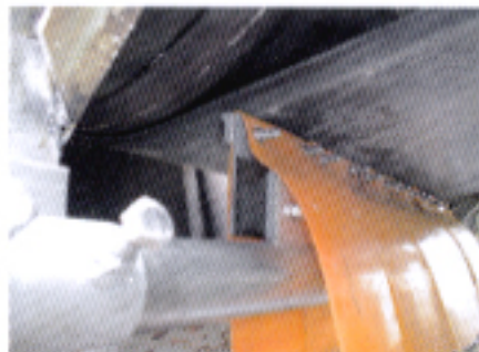
Racleur de Bandes RCV 98 B2

EN FRANCE, A L'ETRANGER, NOTRE EXPERIENCE NOUS PERMET DE REpondre RAPIDEMENT ET EFFICACEMENT A VOS DEMANDES ET DE REALISER LA SOLUTION LA PLUS FIABLE.